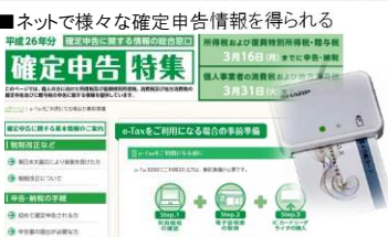
■ネットで様々な確定申告情報を得られる 平成29年申告から末端(ICカードリーダー)が無くても電子申告が可能となる。

平成27年10月に配布されるマイナンバーに伴い来年の申告からは電子申告がようやく加速しそうだ。今まで電子申告をするには住基カードの登録が必要かつ、専用の登録を用意する必要があった。今までは住基カードの登録を促してきたが普及が進まず、マイナンバー導入により強制的に国民全員に管理番号が付与されることで電子申告が普及する。今まで必要であった末端は平成29年申告から不要になる。税務署の窓口では手書きによる相談会やパソコンによる申告資料作成の補助を行っているが年々縮小してきている。マイナンバーについては導入決定しているが広報が少なく導入時に混乱が想定される。