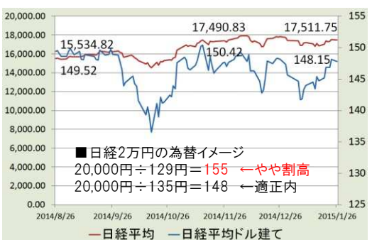
■日経平均2014年 1年チャート

ドル建て計算式: 日経平均÷ドル円=日経平均ドル建て ※最終的に年初から上昇して終えるが、1年の半分は年初からマイナスで推移していた。9月に高値をつけた後は動きが荒かった。