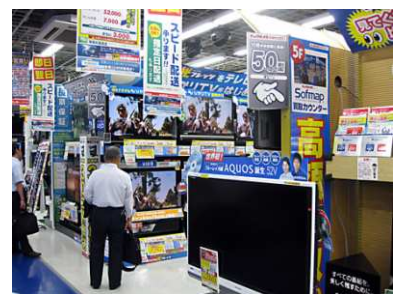
家電大手、ソニー・パナソニック シャープは揃って赤字

落ちたのはソニー、パナソニック、シャープといずれもテレビが売れ筋のメーカーだ。ソニーとパナソニックの株価は32年ぶりの安値を付ける水準まで下落し、いち早くテレビ事業などの不採算部門を閉じる覚悟を決めた東芝・日立の株価とは対照的な結果となっている。有機ELパネルの先駆けソニーは自社単独での開発を諦めパナソニックと手を組む。競争だけでは共倒れしかねない現在では苦肉の策であろう。家電量販店ビックカメラがコジマ電気を買収するなど、業界の生き残り時代へ入ったといえる。